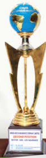
ICMAB AWARD Best Presented Annual Report