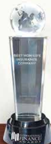
IFM AWARD Best Non-Life Insurance Company