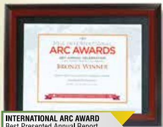
INTERNATIONAL ARC AWARD Best Presented Annual Report