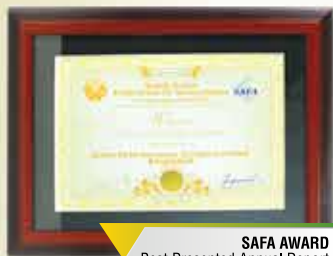
SAFA AWARD Best Presented Annual Report