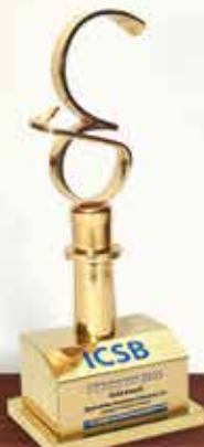
ICSB GOLD AWARD Best Corporate Governance