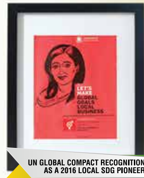
UN GLOBAL COMPACT RECOGNITION AS A 2016 LOCAL SDG PIONEER