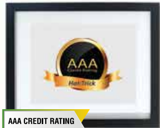
AAA CREDIT RATING