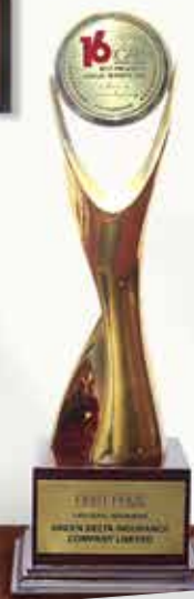
ICAB AWARD Best Presented Annual Report